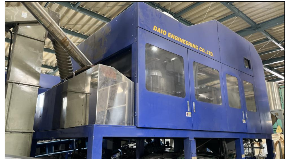
中赤外線選別機 エアロソーターⅤ